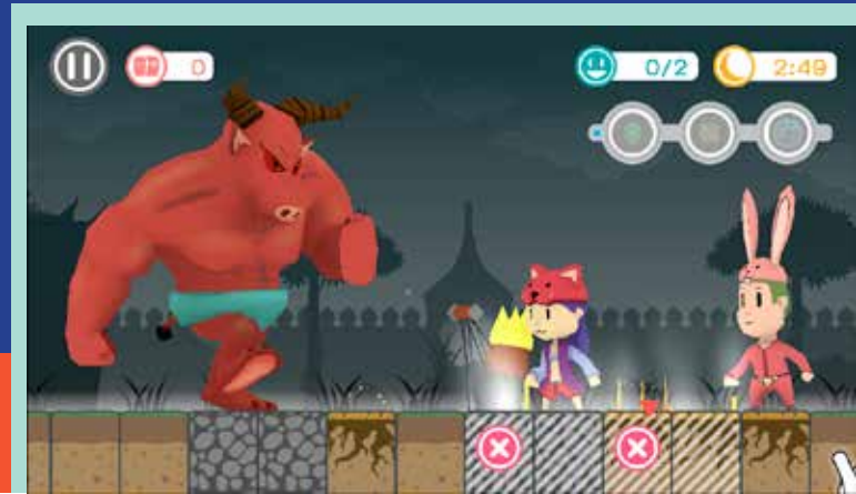
ภาพตัวอย่างผลงานเกม "10 PROTECTOR"