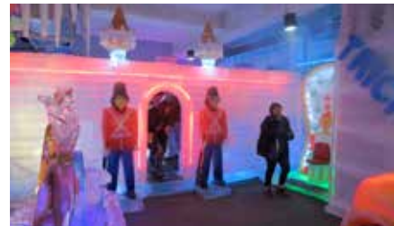
☑️ -4 องศา ที่ ICE MUSEUM

ถ่ายรูปได้แป็บนี้ก็ต้องเผ่นออกมาเพราะซาเริ่มสั้นแล้ว ดูเวลาแล้วยังไม่ถึงเวลาที่นัดรวมตัวกัน ผมเดินออกมาถ่ายรูปเล่นตามร้านค้าหน้ามหา'ลัยขงอีกจนได้เวลาเที่ยงกว่าก็เดินต่อมาอีกนิดหนึ่งก็ถึงร้านหมูย่างเกาหลีบูฟเฟ่ต์ พบกับความอร่อยอีกแล้ว ทุกคนต้องเอาเสื้อหนาวยัดใส่ถุงพลาสติกใบใหญ่ที่ทางร้านเตรียมไว้ให้เพราะมีเข็มนั่นกลิ่นหมูย่างจะติดเสื้อ ร้านนี้บริการตนเองมีหมูหลากหลายชนิดให้เลือก เนื้อวัว ปลาหมึก ไส้ถาดเรียงรายเป็น 10 ชนิด เดินตักได้ไม่อั้น ขออย่างเดียวกัดมาแล้วต้องกินให้หมด ถ้าเหลือจะโดนค่าปรับ เด็กๆ เล่นกันซะแทบอ้วก 555 ผมเดินคุยไปตามโต๊ะเด็กๆ สังเกตเห็นนั่งผู้ฉิ่งทำหน้าเครียด "หล่อน! เป็นอารายไม่อร่อยหรือ" ผมถาม "นุ้รอปลาหมึกสดออกมา รอดตั้งนานแล้ว ยังไม่ออกมาสักที" หล่อนบ่น "ก็กินอย่างอื่นก็ได้นี่จะได้ไม่ต้องรอ" "ไม่เอานุ้จะกินปลาหมึก" หล่อนย่ำทำท่างอลๆ แบบขัดกับใบหน้า... ผมก็ตอบเลย "แถวบ้านเม็งไม่เคยกินปลาหมึกเลยหรือ" เท่านั้นแหละเสียงฮาลั่นร้านเลย 555... อ้ายปลาหมึกสดเอ๊ย!