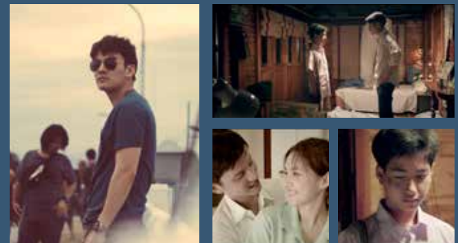
ภาพประกอบโดย : นายสุภาภิต คำมาภิตย์ นายอนันต์ วัชรฤกษ์ศิลป์