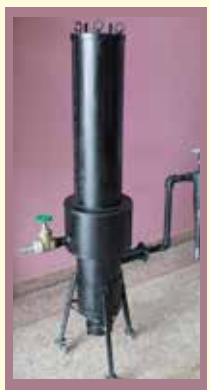
เตาเผาพลังงานชีวมวลทุ้งรังสิต