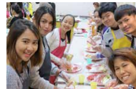
☑️ เด็กๆ ลองทำกิมจิ

ถ่ายรูปได้แป็บนี้ก็ต้องเผ่นออกมาเพราะซาเริ่มสั้นแล้ว ดูเวลาแล้วยังไม่ถึงเวลาที่นัดรวมตัวกัน ผมเดินออกมาถ่ายรูปเล่นตามร้านค้าหน้ามหา'ลัยขงอีกจนได้เวลาเที่ยงกว่าก็เดินต่อมาอีกนิดหนึ่งก็ถึงร้านหมูย่างเกาหลีบูฟเฟ่ต์ พบกับความอร่อยอีกแล้ว ทุกคนต้องเอาเสื้อหนาวยัดใส่ถุงพลาสติกใบใหญ่ที่ทางร้านเตรียมไว้ให้เพราะมีเข็มนั่นกลิ่นหมูย่างจะติดเสื้อ ร้านนี้บริการตนเองมีหมูหลากหลายชนิดให้เลือก เนื้อวัว ปลาหมึก ไส้ถาดเรียงรายเป็น 10 ชนิด เดินตักได้ไม่อั้น ขออย่างเดียวกัดมาแล้วต้องกินให้หมด ถ้าเหลือจะโดนค่าปรับ เด็กๆ เล่นกันซะแทบอ้วก 555 ผมเดินคุยไปตามโต๊ะเด็กๆ สังเกตเห็นนั่งผู้ฉิ่งทำหน้าเครียด "หล่อน! เป็นอารายไม่อร่อยหรือ" ผมถาม "นุ้รอปลาหมึกสดออกมา รอดตั้งนานแล้ว ยังไม่ออกมาสักที" หล่อนบ่น "ก็กินอย่างอื่นก็ได้นี่จะได้ไม่ต้องรอ" "ไม่เอานุ้จะกินปลาหมึก" หล่อนย่ำทำท่างอลๆ แบบขัดกับใบหน้า... ผมก็ตอบเลย "แถวบ้านเม็งไม่เคยกินปลาหมึกเลยหรือ" เท่านั้นแหละเสียงฮาลั่นร้านเลย 555... อ้ายปลาหมึกสดเอ๊ย!