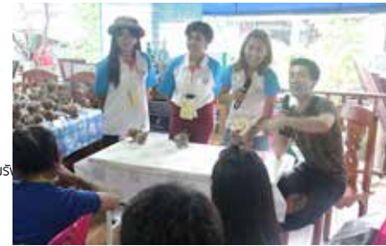
มหาวิทยาลัย