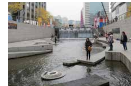
☑️ คลองของเกซอน มีจุดให้โยนเหรียญเสี่ยงทายด้วย

ช่วงบ่ายพวกเราก็มาที่ Duty Free เป็นตึกที่รวมสินค้าแบรนด์ดังทั้งหลาย ผมแบ่งเด็กเป็น 2 กลุ่ม พวกหน้าตาไม่ดีแต่มีตังค์ก็ไปช้อปปิ้ง ส่วนกลุ่มพวกหน้าตาดี (อย่างผม) แต่ไม่มีตังค์ ก็แยกมาเดินเล่นถ่ายรูปที่คลองของเกซอน เดิมเป็นคลองน้ำเน่า สลิมเพียบ รดตืดสุดๆ ไม่มีใครอยาก จะเดินผ่าน ต่อมาปี 2003 รัฐบาลได้บูรณะคลองใหม่ แล้วพุ่มงบกว่า 386 พันล้านวอน พัฒนาจนน้ำใสสะอาด เป็นสถานที่พักผ่อนหย่อนใจสุดฮิตของชาวกรุงโซลและนักท่องเที่ยว ตกเย็นก็มาตอกันที่หอคยองกรุงโซล (Seoul Tower) หอคอยนี้ถือได้ว่าเป็นสัญลักษณ์ของกรุงโซล ตัวหอคอยมีความสูงเกือบ 240 เมตร ซึ่งบางครั้งก็เรียกว่า "นัมซันทาวเวอร์" จุดยอดนิยมของที่นี่จะเป็นการเอาลูกอมจางของคู่รักไปล็อกติดกับกำแพง ตายายเต็มพริตไปหมด หลังอาหารค่ำก็มาละลายทรัพย์ส่งท้ายที่ตลาดยอดนิยมของวัยรุ่นไทยที่ย่านเมียงดง ผมใช้เวลาเดินชอปปิ้งชั่วโมงครึ่ง กว่าจะได้กลับเข้าโรงแรมก็ตึกมากแล้ว