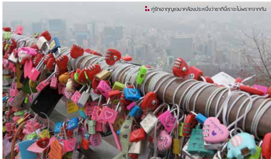
☑️ คู่รักจากทุกมุมโลกจะประหนึ่งว่าขาดใจกันไปพรากจากกัน

สวัสดีครับพี่น้อง นี่ก็เข้าปีใหม่แล้ว ผมขออวยพรย้อนหลังให้ทุกท่านที่เป็นแฟนคอลัมน์ผมมาอย่างเหนียวแน่นตลอดหลายปีที่ผ่านมา ขอให้ท่านและครอบครัวประสบแต่ความสุข ความทุกข์อย่าได้มี อย่าเจ็บ อย่าจนนะคับ... เพียง เอาละคับ ตามผมไปตะลุยแดนโลมกับลูกศิษย์ผมกันต่อดีก่า