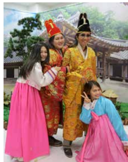
☑️ ใส่ชุดฮันบก... ผมก็เอากระเป๋าด้วย

หลังจากที่ผมเสียความรู้สึกจากร้าน Cosmetic พวกเรามาทานอาหารด้วยกัน Kalbi ไก่บาร์บีคิวผัดซอสเกาหลี พอพวกเราทานกันเกือบเสร็จ ผมก็เริ่มรายการ Talk Show กัดจิกลูกศิษย์โต๊ะโน้นที โต๊ะนี้ที เด็กๆ ก็ไม่ยอม รุมผมกลับทั้งหมดเลย นับเป็นบรรยากาศที่เป็นกันเอง หนักหนานระหว่างศิษย์กับครูที่นานๆ ครั้งผมจะรู้สึกสนุกไปด้วยกับพวกเขาเหล่านั้น จนโกด์ออกปากเลยว่าเป็นกรุปที่มีแต่เสียงหัวเราะประมาณทุ่หมกว่าๆ ก็ได้เวลาละลายทรัพย์อย่างเป็นทางการที่ย่านทงแดมุน สาวๆ แท้เข้าร้าน Skin Food และ Etude หยิบตะกร้าอย่างรู้านไทยเครื่องสำอางต่างๆ ใส่ตะกร้าอย่างกับแจกฟรีก่อนหน้านั้นรถบัส หนูเอ๋ (โกด์สาว) ถามหน้ารถว่าใครจะซื้อเซรั่มของ Skin Food บ้างให้ยกมือผมก็ยกด้วย สายตาทุกคู่มองแล้วหัวเราะมาที่ผม "จารย์ใช้เซรั่มด้วยหรือคะ" โกด์สาวถามแบบมีเลศนัย "ยังจะใช้อีกหรือป้า" เด็กๆ ตะโกนแซว