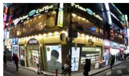
☑️ ร้านเครื่องสำอางยอดนิยมของสาวไทย

แป็บเดียวก็กลับลงมา มีแค่ 2-3 คนเท่านั้นที่ซื้อสายหน่อยก็มาที่โรงเรียนสอนทำกิมจิและจำหน่ายด้วย ที่นี้เค้มีบริการให้ใส่ชุดประจำชาติเกาหลีที่เรียกว่าชุดฮันบก ให้นักท่องเที่ยวได้ลองใส่ถ่ายรูปด้วย เด็กๆ แย่งชุดใส่แปลงร่างกันเป็นที่หนักหนาน ผมก็เอากะเค้ด้วย แต่ที่ย่าสุดเห็นจะเป็นนั่งแต่ตัวแค 2 นางที่หน้าแบบว่า... กรมศิลปากรไม่รับบั้นหน้าแฉ่นอน 555 สองนางดันไปเอาชุดของผู้หญิงเกาหลีมาใส่ บวกกะหน้าตาอุบาทว์ ผมเห็นแล้วอยากไปบวชซะให้ปลงทางโลกไปเลย 555 ต่อจากนั้นก็เข้าห้องสอนทำกิมจิ เค้เตรียมอุปกรณ์ต่างๆ ไว้ให้ครบ พวกเราที่แค่เอาซอสมาป้ายๆ ตามใบหัวผักกาดเท่านั้นเป็นอันเสร็จ ทุกคนก็แอ๊คทำถ่ายรูปกันกระจาย ประมาณ 10 โมงกว่าๆ ก็มาที่ TRICK EYE MUSEUM เป็นการสร้างภาพโดยใช้เทคนิคพิเศษจากภาพสามมิติที่รวมทฤษฎีทางวิทยาศาสตร์และการซ้อนภาพโดยกระตุ้นความเคลื่อนไหวของภาพให้มีมิติเหมือนจริงโดยให้ผู้ชมเข้าไปมีส่วนร่วมถ่ายภาพ เมื่อผ่านเข้าไปในภาพนั้นๆ ภาพทุกภาพจะออกมาดูประหนึ่งเหมือนจริงในเหตุการณ์ เสร็จแล้วก็มาต่อที่ ICE MUSEUM ที่อยู่ใกล้ๆ กัน ภายในอุณหภูมิ -4 องศา แกะสลักก้อนน้ำแข็งเป็นรูปต่างๆ ผมอยู่