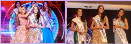
ภาพจากการประกวด มิสอินเตอร์