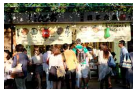
■ ร้าน Kokonoe ชาคาปูแบงทอดในตำนาน

อยู่หน้าทางเข้าวัดเซนโซจิ และที่ขาดไม่ได้ในการเดินทางมาวัดเซนโซจิคือ การแวะชิมชาคาปูแบงทอด ร้าน Kokonoe ในตำนาน ระหว่างเดินรับลมรอบๆ วัด ชมวิว Tokyo Skytree ริมแม่น้ำซูมิดะ ท้องก็เริ่มร้อง ได้เวลาเดินเนอร์มี้อแรกในญี่ปุ่นแล้วครับ ที่ร้านอาหารเล็กๆ ระบบอัตโนมัติหยอดเงินใส่ตู้พร้อมเลือกเมนูของคุณลุงคุณป้าแสนใจดี ที่แม้เราจะงมโข่งหาวิธีอยู่นานแสนนาน เพราะตั้งแต่เกิดมาไม่เคยพบเจอระบบนี้ แต่คุณป้าเจ้าของร้านก็เดินเข้ามาจัดการให้เสร็จสรรพ อิมอรอยสบายท้อง ก่อนออกจากร้านโค้งคำนับขอบคุณคุณลุงคุณป้า 3 ครั้ง หลังจากนั้นก็เดินเก็บบรรยากาศช่วงเย็น ชมไฟภายในวัดและบริเวณรอบๆ อีกสักพัก ก่อนเดินทางกลับที่พักเก็บแรงไว้และศึกษาเส้นทางสำหรับโปรแกรมในวันรุ่งขึ้น วันที่ 2 ในดินแดนอาทิตย์อุทัย เช้านี้