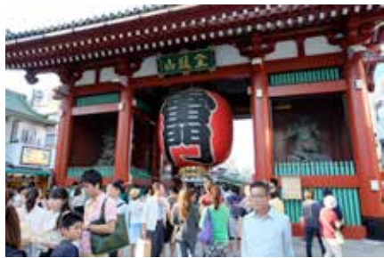
■ ซุ้มประตู Kaminarimon หน้าทางเข้าวัดเซนโซจิ

อยู่หน้าทางเข้าวัดเซนโซจิ และที่ขาดไม่ได้ในการเดินทางมาวัดเซนโซจิคือ การแวะชิมชาคาปูแบงทอด ร้าน Kokonoe ในตำนาน ระหว่างเดินรับลมรอบๆ วัด ชมวิว Tokyo Skytree ริมแม่น้ำซูมิดะ ท้องก็เริ่มร้อง ได้เวลาเดินเนอร์มี้อแรกในญี่ปุ่นแล้วครับ ที่ร้านอาหารเล็กๆ ระบบอัตโนมัติหยอดเงินใส่ตู้พร้อมเลือกเมนูของคุณลุงคุณป้าแสนใจดี ที่แม้เราจะงมโข่งหาวิธีอยู่นานแสนนาน เพราะตั้งแต่เกิดมาไม่เคยพบเจอระบบนี้ แต่คุณป้าเจ้าของร้านก็เดินเข้ามาจัดการให้เสร็จสรรพ อิมอรอยสบายท้อง ก่อนออกจากร้านโค้งคำนับขอบคุณคุณลุงคุณป้า 3 ครั้ง หลังจากนั้นก็เดินเก็บบรรยากาศช่วงเย็น ชมไฟภายในวัดและบริเวณรอบๆ อีกสักพัก ก่อนเดินทางกลับที่พักเก็บแรงไว้และศึกษาเส้นทางสำหรับโปรแกรมในวันรุ่งขึ้น วันที่ 2 ในดินแดนอาทิตย์อุทัย เช้านี้