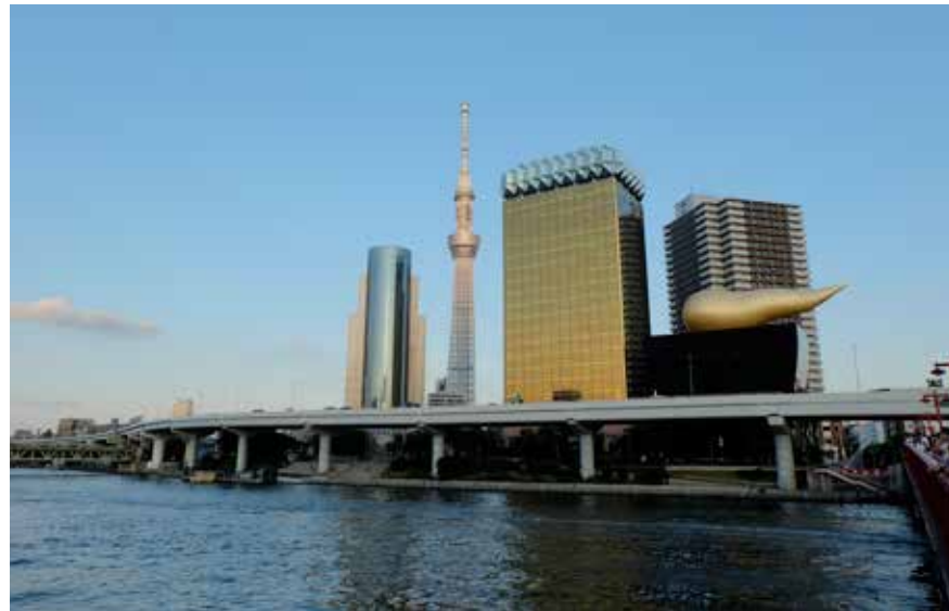
■ Tokyo Sky Tree จากริมแม่น้ำซูมิดะ