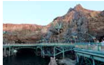
■ มงกุฎไข่มุกของฟ้ากับ Mysterious Island