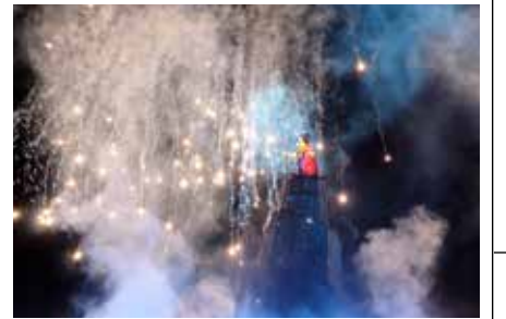
■ ผีกับเมฆน้ำกับโชว์พลุแสนอลังการ

ฝันของเด็กๆ ทุกคน จากเขตชินากาวา เราเดินทางด้วยรถไฟข้ามมายังดินแดนมหัศจรรย์สุดทรรษา ณ Tokyo Disney Station และนั่งรถไฟต่อมายังจุดหมายของเราคือ Tokyo DisneySea ครับ (ที่ญี่ปุ่นจะแบ่งเป็น Tokyo Disneyland และ Tokyo DisneySea) โดยซื้อตั๋วแบบ Starlight Passport ล่วงหน้ามาจากบ้านเรา เมื่อก้าวเท้าออกจากสถานีเหมือนเจอมนต์สะกดให้ย้อนกลับไปเป็นเด็กอีกครั้ง กับบรรยากาศที่น่าตื่นตา ตื่นใจ ขวนให้ตื่นเต้นสุด ๆ