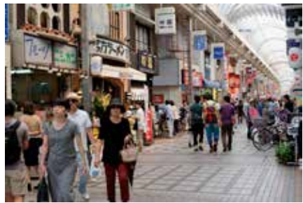
■ ซุป ฮิม ฮิล ที่ตลาด Musashi Koyama