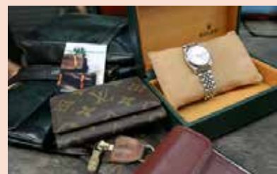
■ ภาพประกอบจากอินเทอร์เน็ต

และสิ่งเดียวที่จะสามารถต่อต้านกับค่านิยมที่มองค่าของคนที่สิ่งของเครื่องใช้ได้นั้นก็คือ การปรับและสร้างทัศนคติที่เป็นตัวของตนเองไม่ตามกระแสตามจนเกินไป รู้จักมองครอบครัวอย่างจริงจัง และเมื่อไรก็ตามที่คิดว่าตัวเองเป็นจุดด้อยให้ลองหันกลับไปมองผู้ที่มีโอกาสน้อยกว่าเรามากมายบอกกับตัวเองว่า “โชคดีแค่ไหนแล้วที่เรามายืนอยู่ถึงจุดนี้” เมื่อไรก็ตามที่เราคิดถึงด้านบวกและมองเห็นคุณค่าของตัวเองอยู่เสมอเราก็จะมีความสุขในสิ่งที่เราเป็นอยู่นั่นเอง