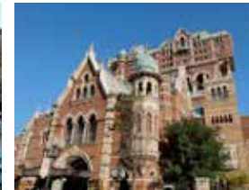
■ KKKSS บ้านผีสิง Tower of Terror