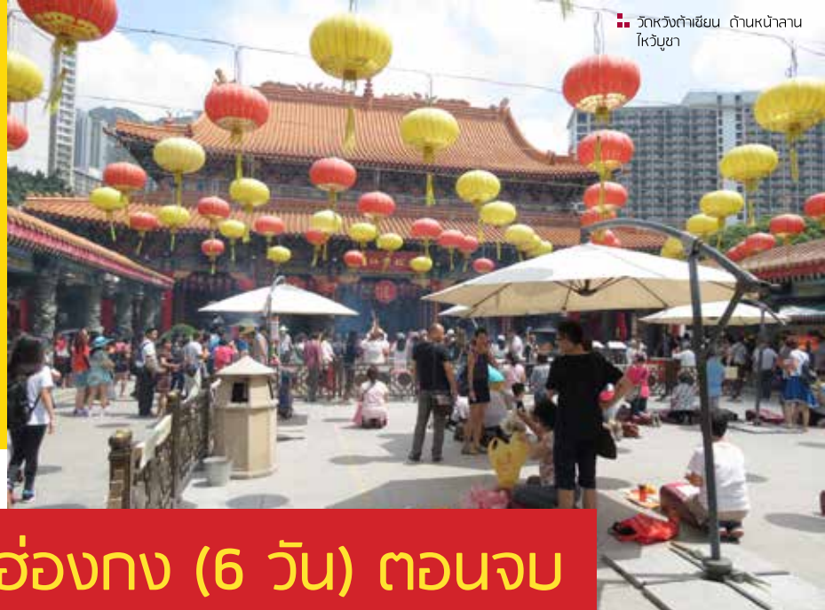
วัดหวังคำเขียน ถิ่นหน้าลานโพธิษา