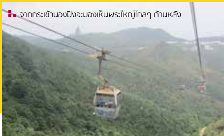
จากกระเช้ามองบึงจะมองเห็นพระพุทธรูปโลกา ถิ่นหลัง