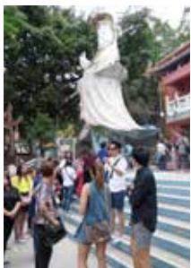
องคัจ่าเมกวนฮับที่ฮ่าว REPULSE BAY กวนฮับ