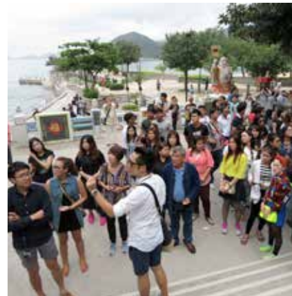
อาจารย์และเด็กๆ กำลังสนใจฟังโถงเล่าเรื่องราวเจ้าเมกวนฮับ