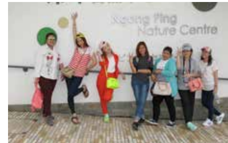
เด็กบรการจ่า... รุ่ยฮั๋ง