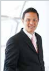
ดร.พงศ์ภัทร อนุมัติราชกิจ รองอธิการบดีฝ่ายกิจการนักศึกษา มหาวิทยาลัยรังสิต