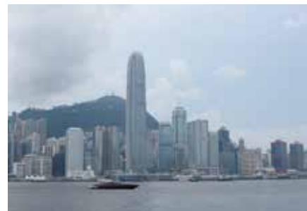
วิวริ่นฮ่าวฮ่องกง

เช้าวันเสาร์ที่ 30 พ.ค. หลังอาหารเช้า ออกเดินทางมาวัดหวังคำเขียนหรือหวังท้อชินในสำเนียงกวางตุ้ง เป็นวัดเก่าแก่กว่าร้อยปีและได้รับความศรัทธามากที่สุดในฮ่องกง เป็นสถานที่ที่เชื่อกันว่าคำอธิษฐานจะประสบผลสำเร็จ พอผมเดินเข้าไปในวัดนึกว่าไฟไหม้ เพราะควันจากธูปตลบอบอวลไปหมด หายใจแทบไม่ออก แสบตาอีกต่างหาก ผู้คนทั้งชาวจีนและนักท่องเที่ยวชาวเอเชียต่างเบียดเสียดกัน พวกเราใช้เวลาครึ่งชั่วโมงแล้วรีบฝ่าฝูงชนขึ้นรถที่เย็นสบายกว่า สายหน้อยก็มาต่อที่กระเช้าบึง นั้งกระเช้าไฟฟ้าข้ามเกาะ ผมได้นั่งกระเช้าร่วมกับเด็กๆ เก่งโรอิญญาชาย 4 หญิง 3 ผมอีก 1 รวมเป็น 8 คนพอดีระหว่างทางนักศึกษาหญิงนั่งนึ่งเจียบน้ำตาไหลเพื่อนชายพูดแห่ "เป็นอารายเมิงน้ำตาไหล... กลัวหรือ" "พวกเมิงเฉยๆ เออะ... กรุเครียดตด"