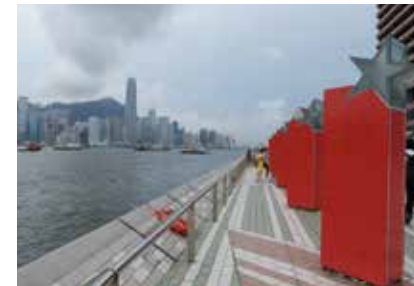
Star of Avenue

ผมจี้กั๊งเลย ใช้เวลาประมาณ 25 นาที เดินขึ้นเนินไปนมัสการพระใหญ่วัดโพธิ์หลินหรือพระใหญ่อันเตา สร้างโดยคณะสงฆ์แห่งวัดโพหลิน เป็นองค์พระขนาดใหญ่ ทำจากทองสัมฤทธิ์หนัก 250 ตัน สูง 34 เมตร นั้งอยู่บนฐานกลีบบัว ยกพระหัตถ์ขวาและแบพระหัตถ์ด้านซ้ายไว้บนตัก พระเนตรจ้องมองลงมา เหมือนดั่งว่ากำลังประทานพรให้แก่ผู้ที่ไปกราบไหว้ หากต้องการสัมผัสกับองค์พระแบบใกล้ๆ ต้องเดินเท้าขึ้นบันได 268 ชั้น มีจุดแวะพักไปเรื่อยๆ ขึ้นไปถึงด้านบนแล้วเห็นวิวทิวทัศน์ของเกาะฮ่องกงได้อย่างชัดเจน หลังอาหารเที่ยงช่วงบ่ายกว่าๆ แล้ว โกดักัพาเดินมาที่ CITY GATE OUTLET มีสินค้าราคาพิเศษให้เลือกซื้อปึงฮิสระ คราวนี้ได้เจอของแบรนด์แท้ๆ ของจริง มีอยู่ 2 สาวไปถอย PRADA และ GUCCI