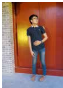
"กั๊งมือพีะหวั่นไหว แต่หัวใจฟั้ง... จารยัถ"