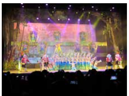
■ การแสดงสุดอลังการรศรศรศา ไว่พารานส์

วัดที่เจ้าปกครองสิบสองปันนาใช้เป็นทีให้พระและประกอบศาสนกิจ ภายในวัดมีวิหาร อุโบสถ และกุฎี ซึ่งเป็นที่จำวัดของพระสงฆ์ รวมทั้งอาคารซึ่งเป็นที่ตั้งของวิทยาลัยพุทธศาสนาของมณฑลยูนนาน ด้านหน้าวัดมีสินค้าของที่ระลึกขายโดยชาวไทลื้อที่พูดภาษาไทยได้ จากนั้นก็มาต่อกันที่หมู่บ้านชาวเผ่าไตจูหรือคนไทยจะเรียกว่ามิดดัจู (มิดจิงฟ้า) คนไทยนี่ก็ซกมก ไปที่ไทมักจะตั้งชื่อ ตั้งฉายาให้เค้าเสียมมนุษย์ตลอด แต่ก็จำง่ายดีคับ ซึ่งหมู่บ้านนี้ในอดีตเคยตีมิดดวายฮองแต้ แต่ปัจจุบันได้นำมาแสดงโชว์การใช้มิดและคุณสมบัติของมิดอันโดดเด่นทั้งหันทั้งลับที่แตกต่างจากมิดทั่วๆ ไป คนที่ไซร์สรรพคุณก็พูดไทยเก่งมากและฮากกระจาย เธอเปิดฟลอร์ด้วยการหยิบแดงร้านลูกยาว หันฉับๆ จนกุดหมด "เหิงม้ายคะ มิดดัจูของเราคมแค้นหาย จู