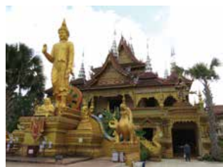
■ วัดหลวงเมืองลือ

รอบๆ พวกเราไปทันได้ชมรอบ 10 โมงเช้า พอได้เวลาเริ่มสระน้ำ เจ้าหน้าที่จะเป่านกหวีดเป็นระยะๆ นกยูงไม่รู้มาจากไหนเป็นร้อยๆ ตัว ออกจากป่าบินลงมากินอาหารที่เค้าไปปรยให้ ดูตื่นตาตื่นใจมาก ลักพักใหญ่จะว่านกยูงกินไม่ทันอ้อมแงๆ จะมีสาวๆ มาไล่ให้บินกลับไป เพราะถ้านกกินอ้อมแล้ว เดี่ยวรอบๆ จะไม่มา คงซีเกียจ แอบจับและอุ้งนได้ 555 ประมาณ 11 โมง น้องล่า โกดสาวก็พามาที่ศูนย์วิจัยทางการแพทย์แผนโบราณ พอไปถึงก็โดนต้อนรับพร้อมฟังเรื่องเกี่ยวกับวิวัฒนาการทางการแพทย์แผนปัจจุบันที่มีการรักษาโรคด้วยสมุนไพร มีอาต้ออาหารม่วยยก