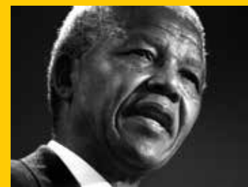
■ เนลสัน แมนเดลา อดีตประธานาธิบดีผิวสีคนแรกของประเทศแอฟริกาใต้