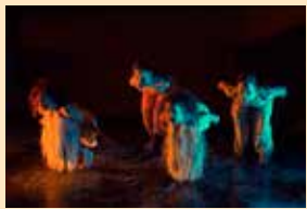
■ การแสดง 'บูโต' ที่สื่อสารผ่านการเคลื่อนไหวร่างกาย