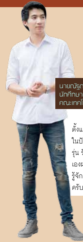
นายวีรณัฐ ยศสิงห์ นักศึกษาชั้นปีที่ 1 สาขาวิชาสารสนเทศการลงทุน คณะเทคโนโลยีสารสนเทศ