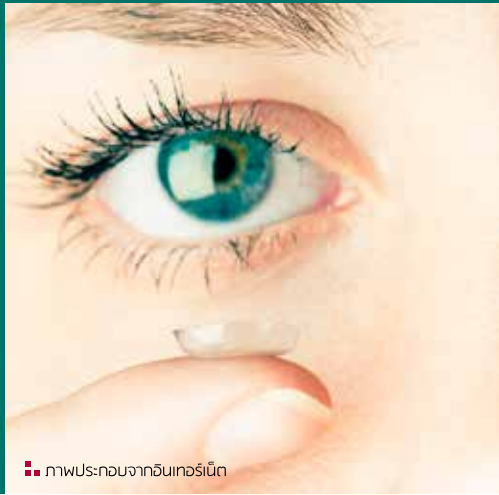
ภาพประกอบจากอินเทอร์เน็ต

การใช้คอนแทคเลนส์ในปัจจุบันนั้นเป็นที่นิยมอย่างมากโดยมีวัตถุประสงค์ในการใช้ เช่น การแก้ไขหรือช่วยในเรื่องของสายตา ความสวยงาม เป็นต้น โดยเฉพาะในช่วงระยะเวลาที่ผ่านมา "คอนแทคเลนส์" (Contact Lens) หรือเลนส์สัมผัส ได้รับความนิยมอย่างมากโดยเฉพาะอย่างยิ่งในกลุ่มวัยรุ่น เพื่อนำมาใช้ในเรื่องความสวยความงาม เช่น เปลี่ยนสีดวงตา ทำให้ตาโตขยับใหญ่และกลมโตกว่าปกติ ที่เรียกว่า บิ๊กอาย (Big Eye) ซึ่งที่ผ่านมามักมีผู้ป่วยมีการอักเสบติดเชื้อที่ตาเนื่องจากการใช้บิ๊กอายอยู่หลายราย ดังนั้น เทคนิควิธีการใช้ที่ถูกต้องและปลอดภัย จึงเป็นสิ่งสำคัญ Health Tip ฉบับนี้มีวิธีการใช้อย่างไรให้ปลอดภัยมาฝากกันครับ