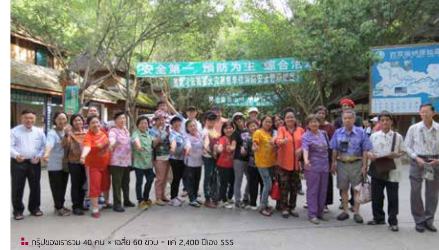
■ กรุ๊ปของเรารวม 40 คน x เฉลี่ย 60 ขวบ = ใ้แก่ 2,400 ปีอง 555

ขึ้นในภายหลัง ภายในสวนมีต้นโพธิ์สองต้นซึ่งเป็นสัญลักษณ์ของมิตรภาพระหว่างไทย-จีน ที่สมเด็จพระเทพรัตนราชสุดาฯ ได้ทรงปลูกไว้เมื่อคราวที่พระองค์ท่านเสด็จฯ เยือนเมืองเชียงรุ่ง ด้านหลังของสวนม่านทิงมีเจดีย์ขาวและเจดีย์แปดเหลี่ยม พวกเราเดินลัดเลาะมาจนถึงวัดหลวงเมืองลือ เป็นวัดพุทธหินยานที่ใหญ่มากที่สุดของจีน โดยการลงทุนก่อสร้างด้วยเงินทุนมหาศาลถึง 350 ล้านหยวน ภายในวัดมีพระพุทธรูปขนาดใหญ่ประดิษฐานอยู่ในส่วนของตัวโบสถ์ได้สร้างด้วยศิลปะผสมผสานกันระหว่างไทลื้อ หม่า ลาว มีลวดลายประจำยามและลายกนกแบบของไทยสอดแทรกอยู่ ภายในเป็นจิตรกรรมฝาผนังขนาดใหญ่เล่าเรื่องพุทธประวัติตั้งแต่ประสูติเรื่อยไปจนถึงปรินิพพาน จนได้เวลาเกือบ 6 โมงเย็น ก็มาทานอาหารค่ำที่ภัตตาคารและชมการแสดงย่อยอาหารของสาว ๆ ชาวไทลื้อที่สวยงามทุกนาง จนได้เวลา 2 ทุ่ม คณะพวกเราก็แยกกัน