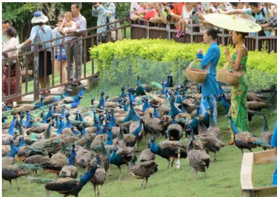
■ เจ้าหน้าทีกำลังเป่านกหวีดเรียกนกยูงให้มาทักทายชม