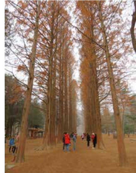
☛ ต้นฤดูหนาวใบไม้ร่วง อากาศหนาวแล้ว

นางตะโกนถามคนชายที่พูดไทยได้ "อย่างหนึ่งหน้าจารย์หนูนี้ใช้ได้ป่าว" คนชายตอบ... หยุดคิดเป๊ปเน็ง จ้องหน้าผม "อย่างนี้ควรไปโบที่อกทั้งหน้าจะดีกว่า" เด็กๆ หัวเราะสนั่นเลย... เออ! พวกเม็งกลับไป F ทั้งหมดเลย ส่วนนั่งคนชายจ๊อยากยิ้มหน้าดับนูหรีจ๊จ...E เวล คราวหน้าร้านนี้กูไม่พากรูปมาลงอีกแล้ว... แง แง ...อ่านอย่างฮาต้อฉบับหน้าจะครึบบบ