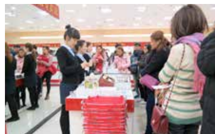
☛ ร้านนี้แหละที่ทำขนมเค้กกับช็อคโกแลต 555

ไถ่อย่าง ซึ่งข้าวเหนียวของเราหนึ่งทีละเม็ดค่า" ตอนจะลงจากเครื่อง "เราขอแนะนำสถานที่ท่องเที่ยวที่น่าสนใจที่กรุงโซล เช่น ...และขอให้ทุกท่านมีความสุขกับการช้อปปิ้งที่เมียงดง และท่านอย่าลืม... (เออเว้นวรรคเสียงเป๊ปเป๊ป) ของฝากให้ลูกเรือด้วยนะคะ... ขอขอบคุณทุกท่านที่ใช้บริการสายการบินของเรา" เสียงปรบมือให้จากผู้โดยสารทั้งลำเลย เรามาถึงสนามบินอินชอนประมาณบ่าย 3 โมงแล้ว (ตามเวลาท้องถิ่น) ได้สัมผัสอากาศหนาวแรก อุณหภูมิประมาณ 6-7 องศา ขึ้นรถบัสมาอีกประมาณชั่วโมงกว่า ซึ่งท้องฟ้าเริ่มมืดแล้วทานอาหารค่ำมื้อแรกสลัดเกาหลี เสริ่งแล้วเข้าที่พักที่ Kensington Resort ห้องพักกว้างขวาง อุปกรณ์ของใช้ครบครัน ที่ได้คิดเห็นจะเป็นซักโครกที่มีปุ่มกดชำระล้างอัตโนมัติ ผมเคยเจอมาแล้ว ขอบอกว่า... เฟลีนมากกกก ผมพักกับลูกศิษย์ชาย สักพักนรกก็มาบังเกิด เพ่กแต่นอนกรนเป็นระยะๆ พอดดึกๆ ก็ตื่นละเมอโวยวายลุกขึ้นมาล้างแล้วขึ้นไปประตู โห! ผมจะสั่งลูกมาคว้าว่านใส่มองตามที่มีมันขึ้นไป กระว่าโดนผีเกาหลีเล่นแ่นๆ รีบคว้าสายสร้อยพระมาใส่คอ เอ... แล้วผีเกาหลีมันจะกลัวพระไทยมั๊ยเนี่ย... ช่วยอ้ายเวลเอ๊ย 555