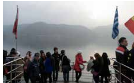
☛ บนกัปตันเรือข้ามไปเกาะนามิ

อารายอยู่... จะดูบัตรอาจารย์มั๊ยน้อง ผมถามในใจ 555 กรุ๊ปของเราเกือบ 40 คน มาครบตอนตี 5 ผ่าน ดม. เครื่องออกตอน 08.30 น. เราใช้สายการบินแอร์เอเชียเอ็กซ์ที่ผมสั่งจองอาหารบนเครื่องบินแล้ว เป็นข้าวหน้าไก่ทอดรียากิ เด็กๆ เล่นกันซะแทบจะกินกล่องเข้าไปด้วยเลย ไฟลด์นี้ผมชอบผู้ประกาศสาวบนเครื่องบินมาก สีสาวเสียงการพูดประกาศแบบนี้ๆ ของเธอทั้งภาษาไทยและอังกฤษผู้โดยสารนั่งอมยิ้มกันทุกคน เช่น "วันนี้เราขอเสนออาหารแสนอร่อย ข้าวเหนียว