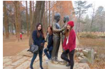
☛ เก็ทๆ แ่่งกันถ่ายรูปกับพระเอก นางเอกหนึ่งถึง