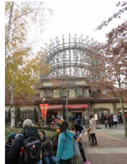
☛ มีทะเลกับเครื่องเล่นสกีไฟทะเลวางไว้ที่เก็ทๆ ไม่หวั่นตึกกับ 555

เช้าวันอาทิตย์ที่ 23 พ.ย. สุตรการท่องเที่ยว 6-7-8 Morning Call ตอน 6 โมงเช้า 7 โมง ลงมาทานอาหารเช้า 8 โมง ล้อหมุน จุดแรกที่เรามาชมคือ เกาะนามิ หนูเอ๋ โกดสาวผู้มากประสบการณ์ ได้ให้พวกเรารีบมาที่นี้แต่เช้า เพราะถ้าสายคนจะเยอะมากเพราะเป็นวันอาทิตย์ ทั้งพวกทัวร์และชาวเกาหลีเองจะมาเที่ยวเยอะ