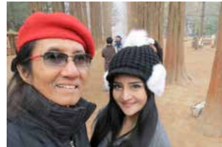
☛ ผมถ่ายกับลูกศิษย์ตัวเกือบ 10 ทุ่มๆ เกาหลีโซลนี่เลย

มาก การถ่ายรูปจะไม่สวย เราใช้เวลาแค่ 7 นาที นั่งเรือข้ามไปเกาะนามิ หนูนิว ทัวร์ลีดเดอร์ก็นำเด็ก ๆ ไปยังจุดถ่ายรูปยอดนิยม คือแนวต้นสนและรูปปั้นโลหะของพระเอกนางเอกจากเรื่อง Winter Love Song ยืนกอดกันมาหลายปีแล้ว มีช่างภาพชาวเกาหลี ชื่ออีโอ ที่รู้มุกยอดนิยมคอยตามถ่ายภาพสวยๆ ให้ อากาศหนาวมาก ท้องฟ้าไม่มีแดดขมุกขมัว มีกองพินสุ่มไฟให้นักท่องเที่ยวได้ผิงไฟรับไออุ่นเป็นระยะๆ เด็กๆ เดินถ่ายรูปกันกระจาย สายหน่อยผู้คนเริ่มแห่กันมาแล้ว พวกเราก็เสร็จภารกิจพอดี กลับเข้าฝั่งเดินทางมาต่อกันที่ไร่แอปเปิ้ล ลูกสาสี ลูกบ๊อบเริ่มเลย เค้ามมีบริการปอกให้ชิม เนื่องจ้อย่างหวานและกรอบมาก ราคาถังละ 50,000 W คิดเป็นเงินไทยก็ 1,500 บาท มี 12 ลูก ตกลูกละ 125 บาทคับ ผมชิมไปก็เกือบ 2 ลูกและ ไม่ต้องเสียดังคั้งได้แกอีก 1 ลูกด้วยจำตกเที่ยงก็มาทานเมนูยอดนิยม หมูย่างเกาหลีที่อร่อยมาก หนูนิวเตรียมน้ำจิ้มแจ่วมาจากเมืองไทยไว้รอทำด้วย ถ้าให้ครบต้องมีข้าวเหนียวด้วยจะครบสูตรเลย เด็กๆ ปิ้งๆ ย่างๆ กินๆ ยัดๆ แบบ