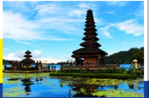
ภาพประกอบจากอินเทอร์เน็ต

ผลที่อาจเกิดขึ้นจากการสัก โรคติดเชื้อ ในอดีตพบเชื้อวัณโรค บาดทะยัก แบคทีเรีย ชนิดต่างๆ เช่น ฝี ไฟลามทุ่ง เชื้อไวรัสตับอักเสบบี ไวรัสเชเอชไอวี ซึ่งควรระวังเพราะมีโอกาสเกิดได้ บางรายเกิดจากความไม่สะอาดของอุปกรณ์และสถานที่รวมไปถึงสุขภาพของผู้ทำการสักด้วย อาการกำเริบของโรคผิวหนังที่เป็นอยู่แล้ว เช่น โรคสะเก็ดเงิน ปฏิกิริยาจากสีของการสัก โดยเฉพาะสีที่เป็นพวกกลุ่มของโลหะ ซึ่งพบว่าอาจก่อให้เกิดอันตรายได้ ปฏิกิริยาที่พบได้คือ มักมีอาการคัน และผื่นผิวหนังอักเสบกระจายทั่วตัว ซึ่งเชื่อว่าเป็นการเกิดจากปฏิกิริยาภูมิไวเกินต่อสีที่ใช้สัก และเมอร์คิวริคซัลไฟด์ (Mercuric Sulphide) เป็นสารที่พบบ่อยที่สุด ดังนั้น การป้องกันการเกิดปัญหาดังกล่าวคือ การเลือกร้านหรือสถานที่ที่สะอาดได้มาตรฐาน การเลือกใช้สีที่ปลอดภัยอาจเช็คได้จากประวัติข้อมูลของผู้ที่เคยใช้บริการหรือสอบถามว่าใช้สีประเภทไหนเป็นบริษัทที่น่าเชื่อถือหรือไม่