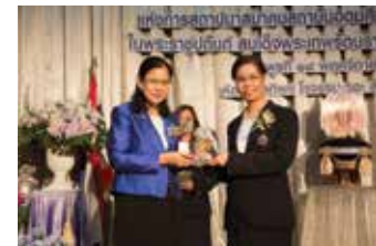
รองศาสตราจารย์ บุคลากรดีเด่นด้านวิชาการ กลุ่มวิทยาศาสตร์สุขภาพ

นอกจากนี้ บุคลากรดีเด่นทั้ง 3 คนยังได้กล่าวถึงท้ายว่า ขอขอบคุณคณะกรรมการที่พิจารณาคัดเลือกให้เข้ารับรางวัลดังกล่าว และที่สำคัญขอขอบคุณผู้บริหารจากคณะและหน่วยงาน มหาวิทยาลัยรังสิต ที่ให้โอกาสได้ทำงาน พิสูจน์ผลงานเรื่อยมา และทุกความสำเร็จที่ได้รับจะรักษาไว้ซึ่งคุณภาพและพยายามพัฒนางานที่รับผิดชอบให้ดียิ่งขึ้นต่อไป