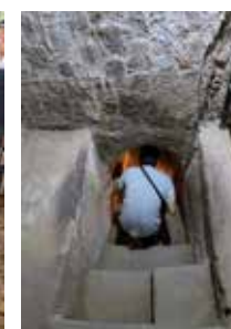
☛ อุโมงค์ทางออกไม่กับ