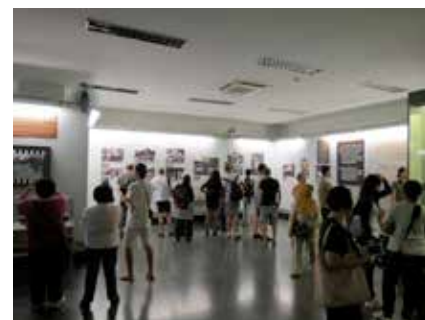
☛ ภายในอาคารพิพิธภัณฑ

เล็ก ๆ ที่ไม่มีอะไรจะเทียบกันได้เลย นอกจาก "ใจแะจิตวิญญาณรักชาติ" ของชาวเวียดนามเอาละคับ ไปเที่ยวที่อื่นกันต่อหลังจากผมดราม่าเล็กน้อย หุ หุ ช่วงเย็นแล้วเรากัมาที่จุดท่องเที่ยวสำคัญของนครโฮจิมินห์ที่โบสถ์นอร์ทเทรอดามแห่งเวียดนาม เป็นโบสถ์หลังคาสูงที่สร้างในสมัยที่เวียดนามยังอยู่ในอาณานิคมของฝรั่งเศส โดยสร้างเพื่อให้เป็นโบสถ์ประจำเมืองโข่งอน โดยได้สร้างตามต้นแบบของประเทศฝรั่งเศส ระหว่างที่พวกเรากำลังเดินไปเพื่อถ่ายรูปกัน ผมเดินคู่มาบับลูกศิษย์สาวที่เออสวยจัดมาก เธอสะดุดจะหกล้มหันหน้ามาทางผม "...แหก" ผมชี้ขำกัากเลย "แกนี้กัอหน้าตาดี แต่เสือกอุทานซะหมดสภาพเบย"