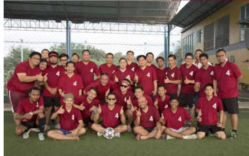
■ การแข่งขันฟุตบอล สนามสังข์พันธ์ สนามฟุตบอล เมืองเอก ปทุมธานี