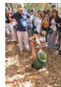
☛ Before and After เมื่อครั้งเวียดนามรบลงอุโมงค์แบบของไม่ออกเลย