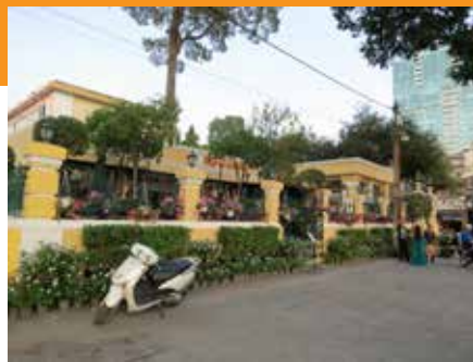
☛ รานกาเพ่นำบ่งอญักลา กับโบส

"หนูขอโทษค่ะป้า" หลอนยกมือไหว้ "ม่ายเปนร้ย... ป้าชอบบับ" เสียงเพื่อน ๆ ฮาเลย เสรีจากที่นี้ เรากัทานอาหารค้ำแะกลับโรงแรม