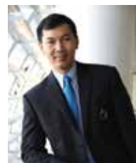
อาจารย์ บุคลากรดีเด่นกลุ่มงานกิจการนักศึกษา ระดับปฏิบัติการ