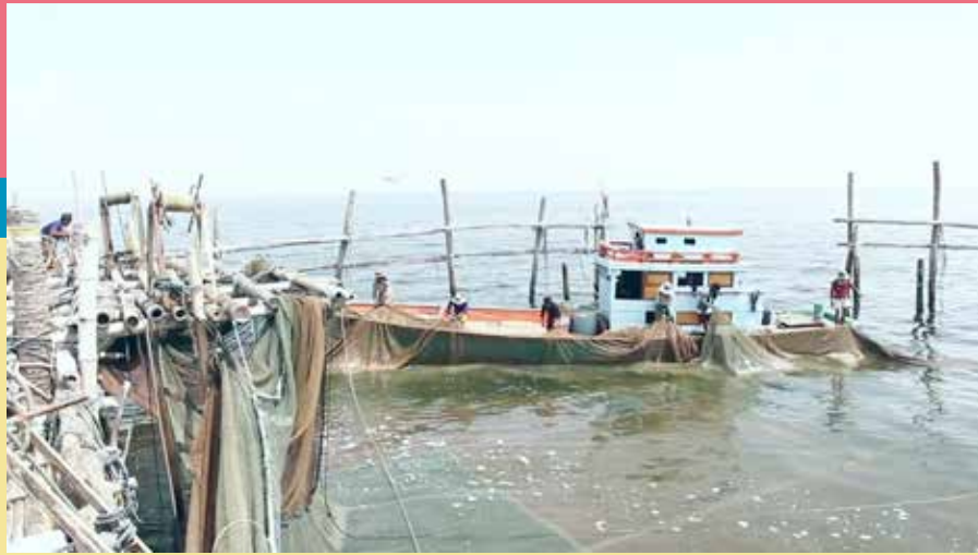
■ ภาพสารคดีเชิงข่าว เรื่อง "ปิ๊ะ"