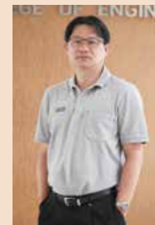
■ ผู้ช่วยศาสตราจารย์รองคณบดีฝ่ายบริหาร วิทยาลัยวิศวกรรมศาสตร์

The Faculty of Engineering Alumni Club, Rangsit University organized the '4 th Re-Union-Widwa Taythoong' at Futsal Field, Muang-Ake, Pathumthani.