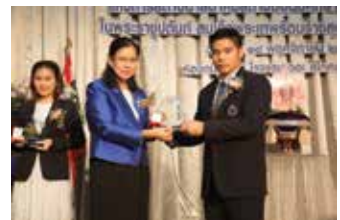
ผู้ช่วยศาสตราจารย์ ดีเด่นกลุ่มงานกิจการนักศึกษา ระดับผู้บริหารหรือหัวหน้างาน