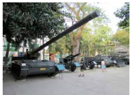
☛ ภาพนอกฉากแสดงอาวุธสหนักต่าง ๆ