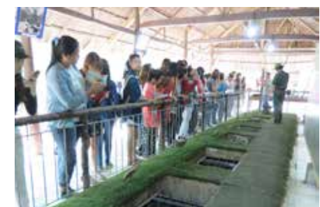
☛ หลุมกับดักแบบต่างๆ ที่ทหารอเมริกันขุดทิ้งไว้

หัวเราะอย่างฮาเลย แต่ที่น่าสะพรึงมากที่สุดเห็นจะเป็นหลุมพรางกับดักที่เวียดนามทำไว้ มีนาเล่พวกอัยกันถึงกัลักกัลัวหนา มีสารพัดรูปแบบเลย เป็นหลุมพรางที่กัหลุมมีไม้แหลมรอเสียบถ้าพลาดตกลงไป บางแห่งก็เปนครานติดเหล็กแหลมพร้อมเสียบ โอ้ย! สารพัดกับดัก ช่วงทางเดินออกจากที่นี้เป็นสนามยิงปืนชนิดที่ใดในโลกไม่มีเหมือน ทั้งปืนอาท้าว ปืน M16 ปืนกล ปืนครก ปืนยิงรถถัง มีให้ลองถ้าท่านมีตังค์จ่าย ผมั้งสะตังเป็นพัก ๆ เพราะเสียงปืนแต่ละชนิดดั่งมากจุดสุดท้ายก่อนออกจากที่นี้จะเป็นจุดพักนักท่องเที่ยวเค้าจะเตรียมขนมแบบที่ทหารเวียดนามกินกันในช่วงสงคราม ขนมที่ว่าคือหัวมันขาวต้มที่จืดชืดมาก ต้องจิ้มพริกกับเกลือปนน้ำตาลที่เค้าเตรียมไว้ให้ ก็อร่อยดีคับ แต่พวกเด็ก ๆ ไม่เอาเลย แะแล้ว