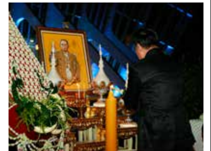
ชาวมหาวิทยาลัยรังสิต น้อมรำลึกในพระมหากรุณาธิคุณพระบาทสมเด็จพระปรมินทรมหาภูมิพลอดุลยเดช