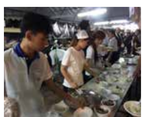
นักศึกษาวิทยาลัยนวัตกรรมการผลิต มหาวิทยาลัยรังสิต ร่วมกิจกรรมจิตอาสาทำดีถวายพ่อหลวง โดยร่วมกันทำข้าวไข่เจียวให้แก่ประชาชนที่เดินทางมากกราบถวายบังคมพระบรมศพ พระบาทสมเด็จพระปรมินทรมหาภูมิพลอดุลยเดช ณ บริเวณห้องสนามหลวง