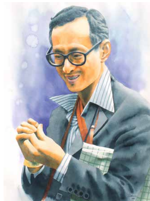
ชื่อภาพ: ในหลวงของแผ่นดิน โดย อาจารย์ปฐม สุปรียาพร