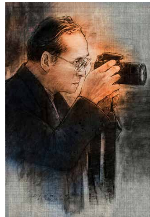
ชื่อภาพ: King of Thailand โดย อาจารย์ตินสิน รักพงษ์โศก