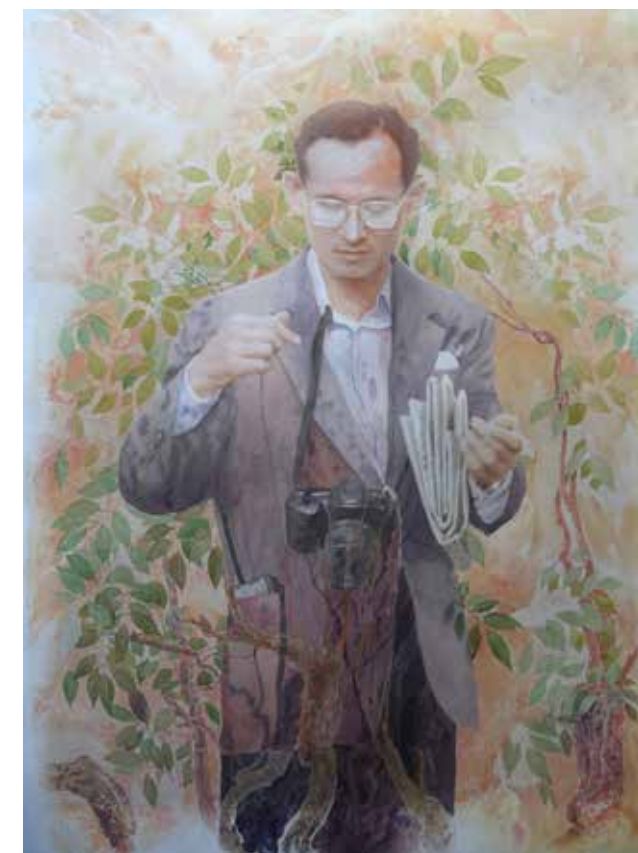
ชื่อภาพ: ต้นไม้แห่งแผ่นดิน โดย ผู้ช่วยศาสตราจารย์ธรรมศักดิ์ เอื้อรักสกุล