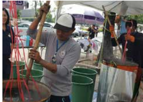
กิจกรรมจิตอาสา รับผิดชอบต่อผ้าสีดำพรี่ และร่วมกับบริจาคเสื้อผ้า เพื่อนำมาย้อมเป็นสีดำบริจาคให้แก่ประชาชน

“พวกเราในฐานะนักดนตรี สิ่งที่เราทำได้คือ เราสามารถบอกทุกคนผ่านเสียงเพลงว่าพระองค์ท่านรักเราขนาดไหน ...” ผศ.ดร.เด่น อยู่ประเสริฐ คณบดีวิทยาลัยดนตรี มหาวิทยาลัยรังสิต