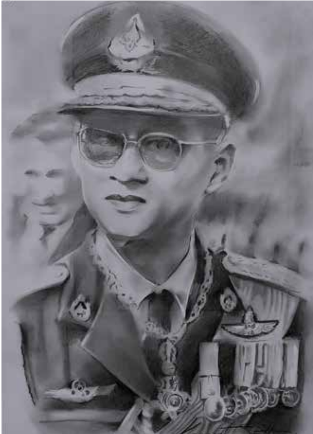
■ Kongrat S.Pattana