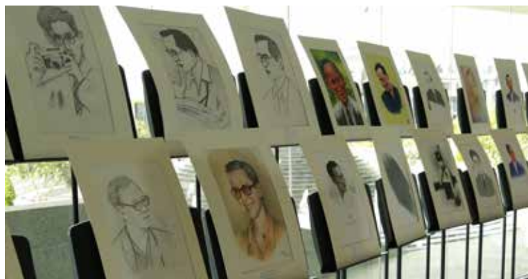
การจัดแสดงภาพวาดพระบรมสาทิสลักษณ์พระบาทสมเด็จพระปรมินทรมหาภูมิพลอดุลยเดช หัวข้อ “ในหลวงในดวงใจ” ผลงานการวาดภาพจากใจของคณาจารย์ บุคลากร นักศึกษา มหาวิทยาลัยรังสิต รวมทั้งบุคคลทั่วไปที่ร่วมถ่ายทอดผลงาน ณ ศาลาดนตรีสุริยเทพ มหาวิทยาลัยรังสิต