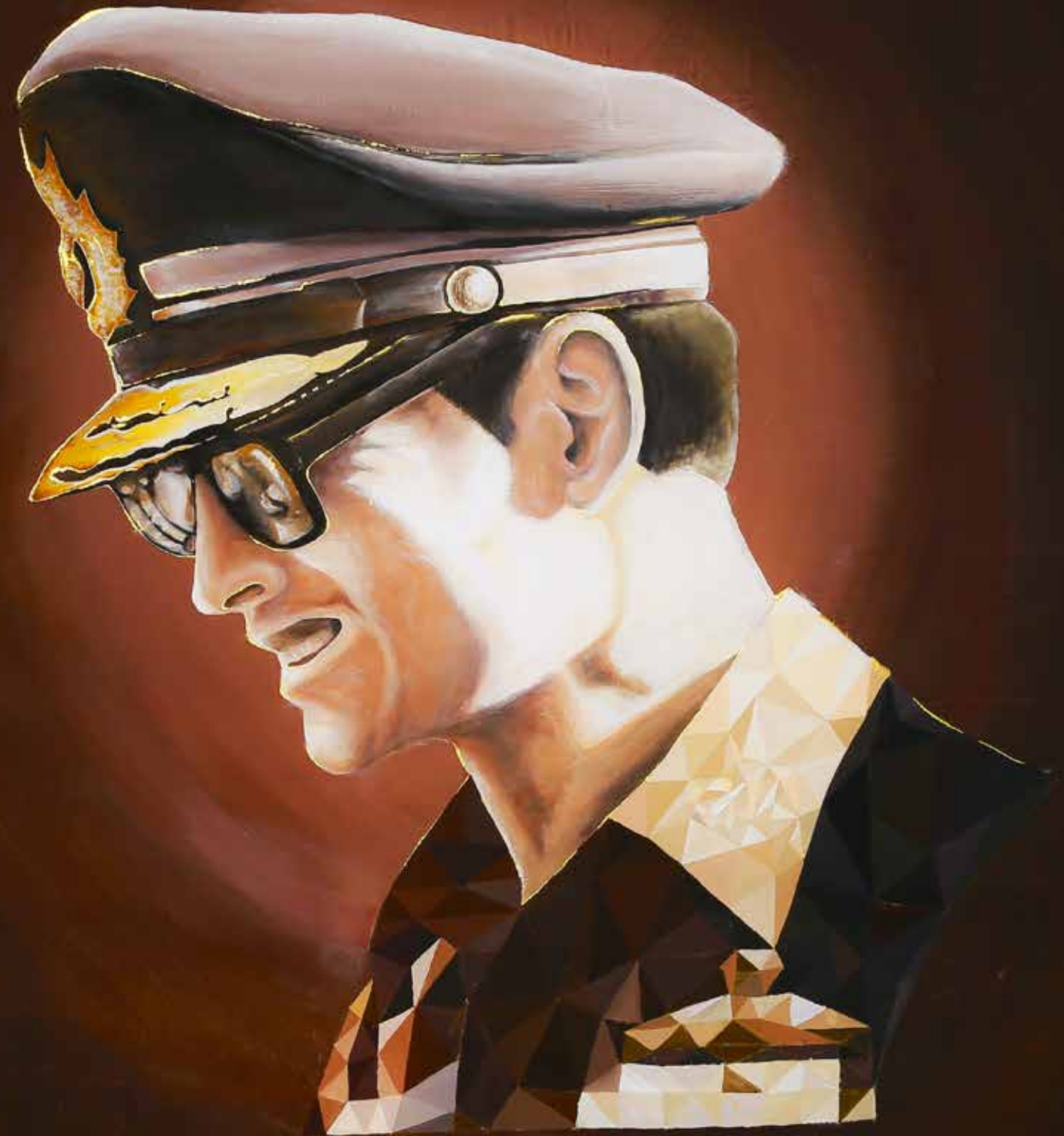
▪ กลุ่มนักศึกษาคณะดิจิทัลอาร์ต