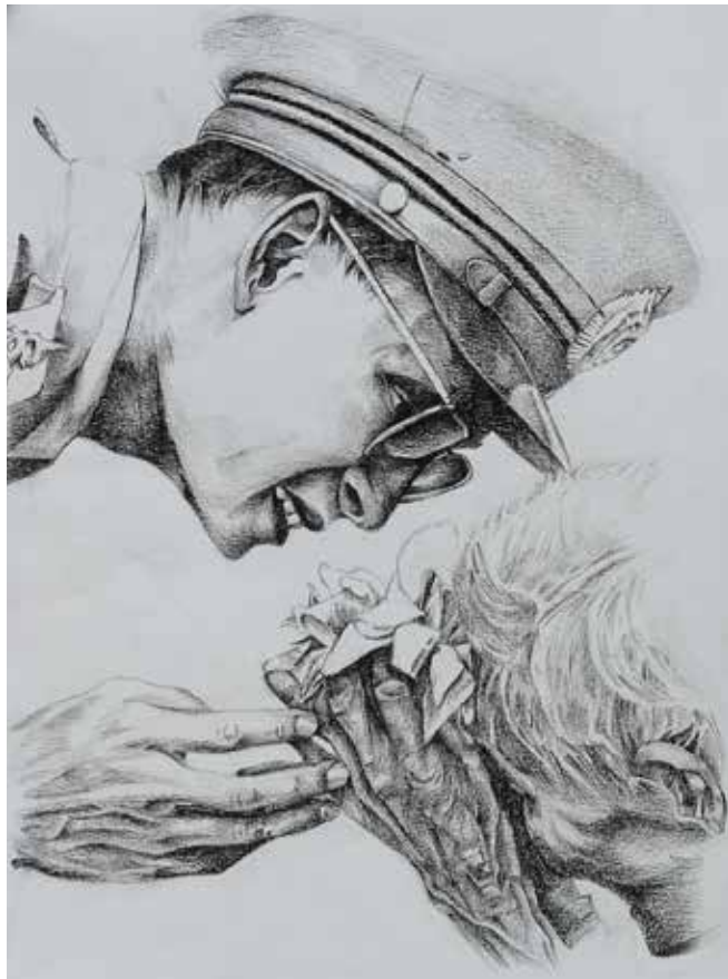
■ เมธาวิ ศรมบุญทิพย์