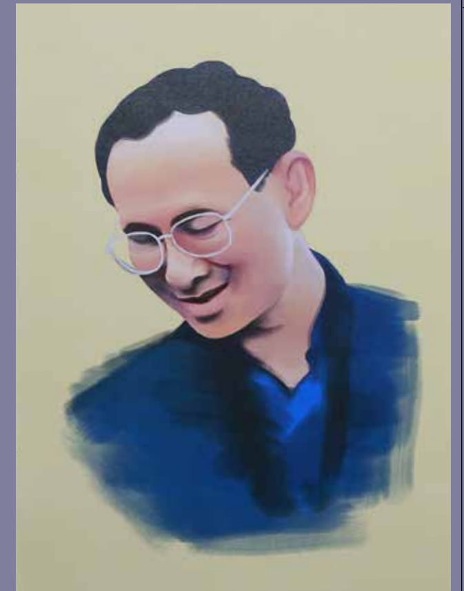
THE 52 HZ